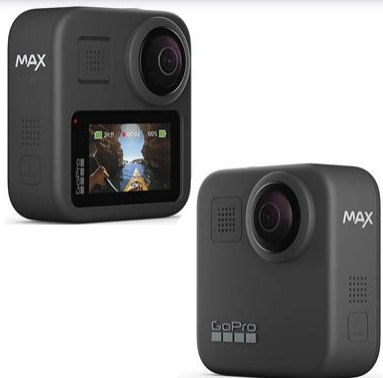
GoPro 360 Max 2